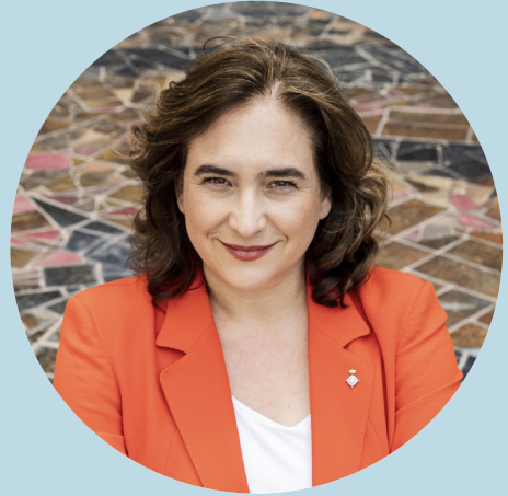
Ada Colau Ballano Alcaldessa de Barcelona