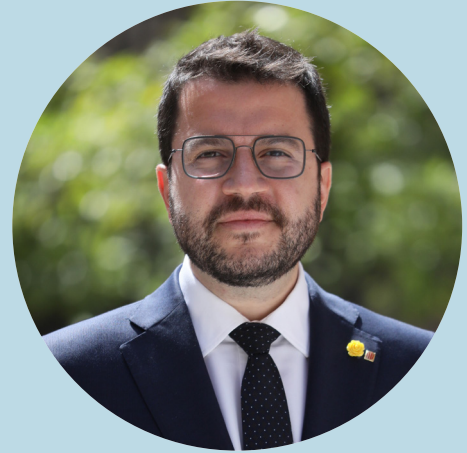
Pere Aragonès i Garcia President de la Generalitat de Catalunya